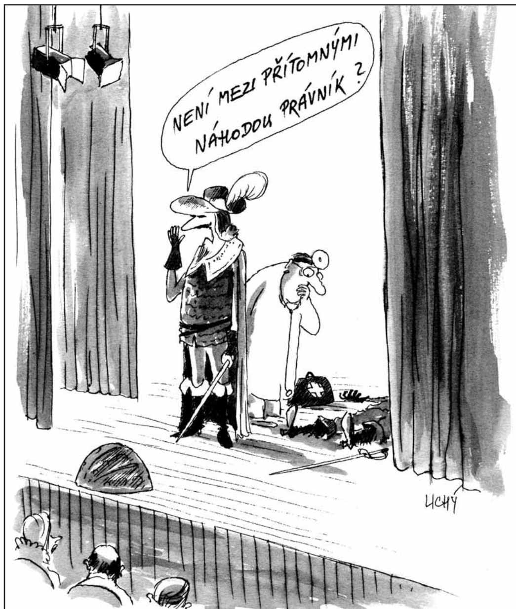
Pro Bulletin advokacie nakreslil Lubomír Lichý